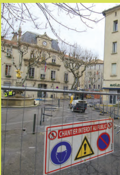
Lundi 18 janvier Début des travaux sur la place de la Juiverie