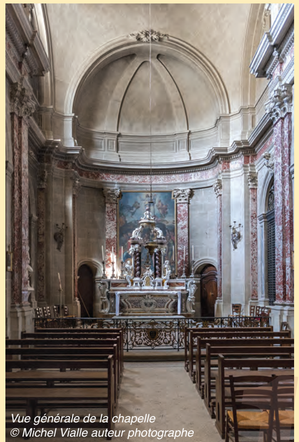
Vue générale de la chapelle

À la fin des travaux de l'hôtel-Dieu, les offices religieux seront donc à nouveau célébrés dans la chapelle dans le respect des dispositions approuvées par chacune des parties.