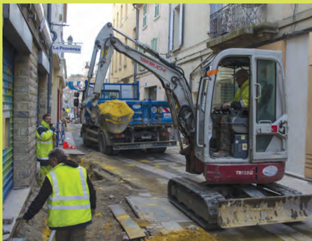
Lundi 4 janvier Travaux dans la rue Porte-de-Montoux