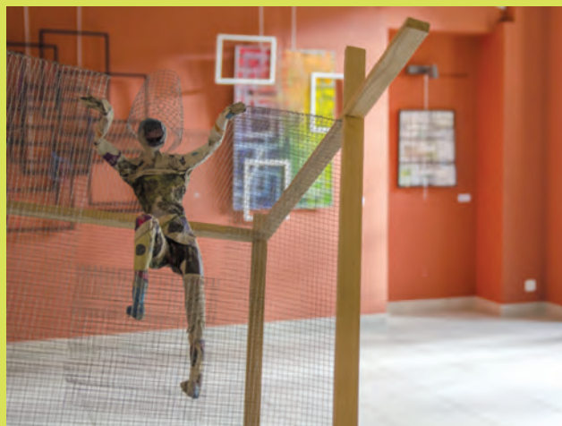
Vendredi 8 janvier Exposition Ariane Sirota MJC