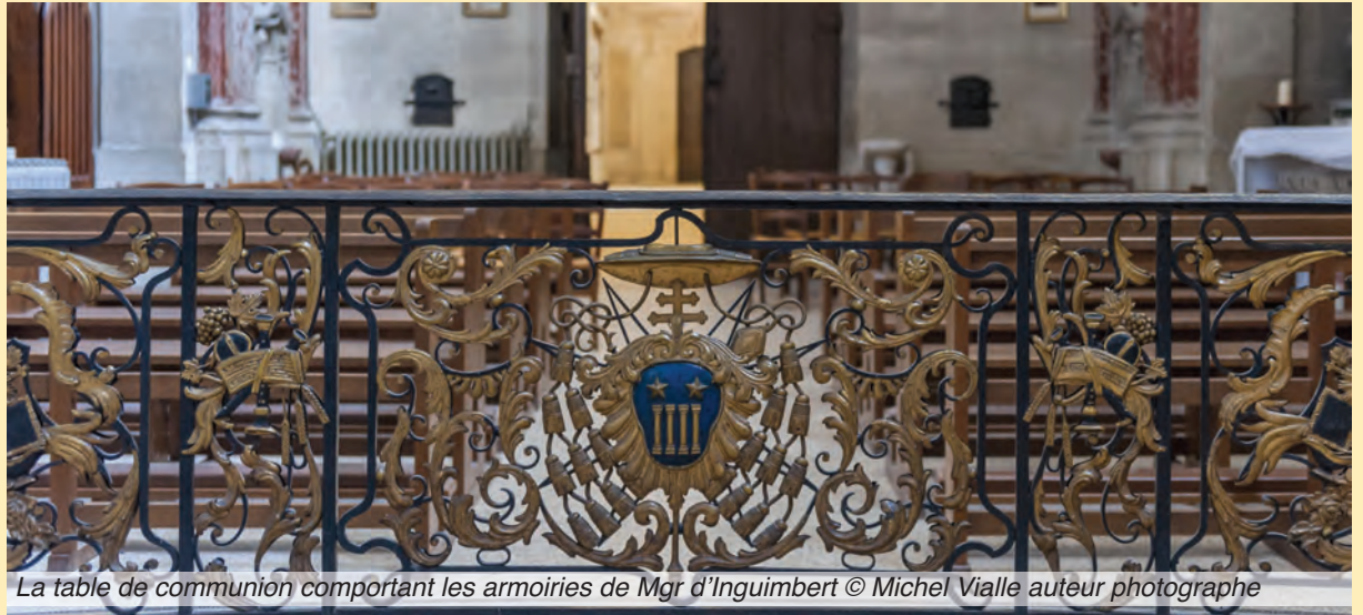
La table de communion comportant les armoiries de Mgr d'Inguibert

Le 10 décembre 2015, une convention de mise à disposition à titre gratuit de la chapelle de l'hôtel-Dieu de Carpentras a été officiellement signée entre la Ville de Carpentras et l'Association diocésaine d'Avignon. Cet accord intervient conformément au jugement du Tribunal administratif de Nîmes du 19 décembre 2014, statuant sur un recours intenté contre la délibération du Conseil municipal de Carpentras du 18 novembre 2013.