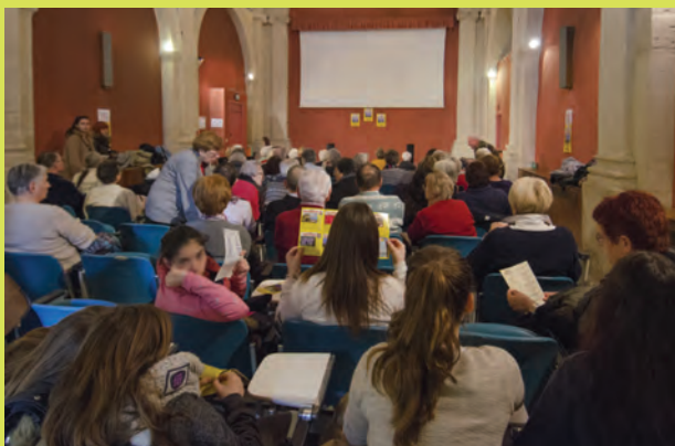
Mercredi 20 janvier Connaissance du Monde sur le Pays basque Chapelle des Pénitents-Blancs