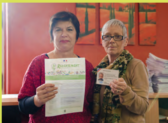
Jedi 21 janvier Début du recensement de la population

Retrouvez la vidéo en flashant le QR code