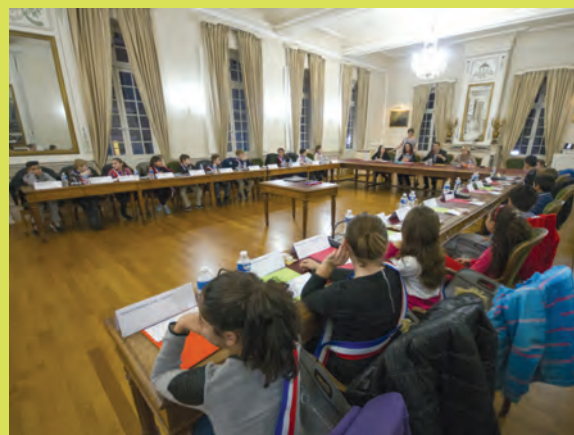
Lundi 11 janvier 1 ère réunion de travail du Conseil municipal des enfants Salle du conseil de l'Hôtel de Ville