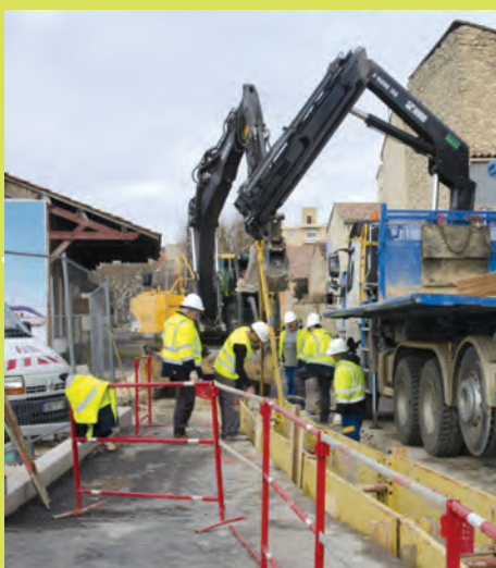
Lundi 18 janvier Début des travaux avenue de la Gare