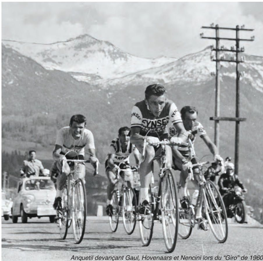
Anquetil devançant Gaul, Hovenaars et Nencini lors du "Giro" de 1960

Du 9 juillet au 12 août, à l'occasion du passage du Tour de France, l'hôtel de ville accueillera une exposition sur Jacques Anquetil.