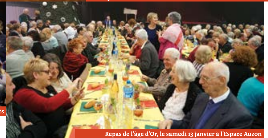
Repas de l'âge d'Or, le samedi 13 janvier à l'Espace Auzon

Les rois et reines du jour ont pu profiter d'un moment de convivialité et rencontrer leurs élus autour de gourmandises.