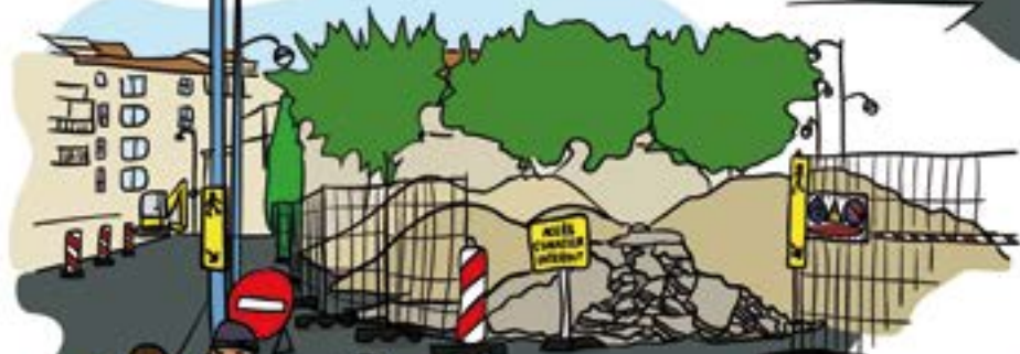
Une voirie rénovée, notamment sur l'avenue Wilson