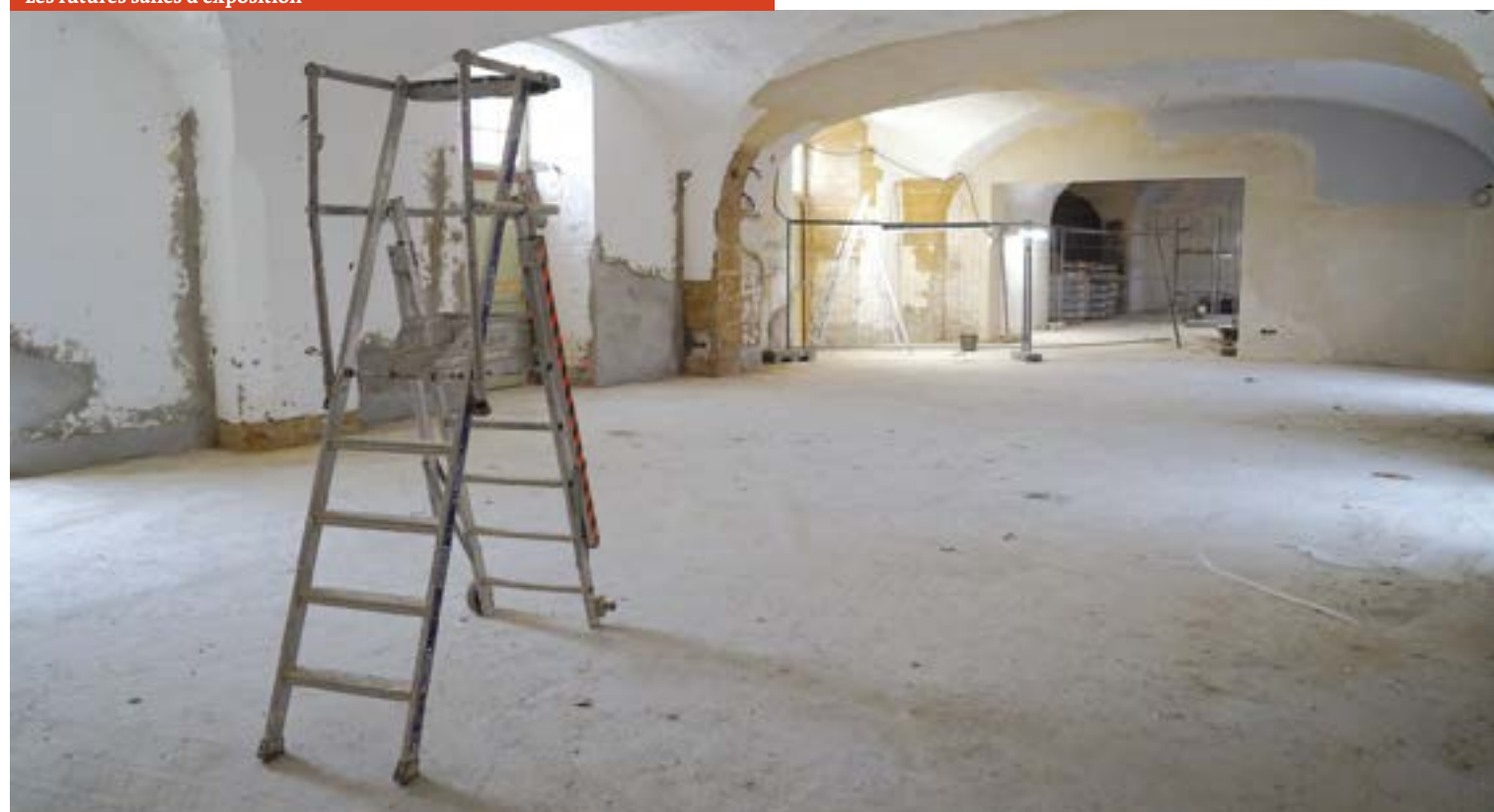
Les futures salles d'exposition

kilos d'aluminium composent l'habillage, les poteaux et les menuiseries de la verrière