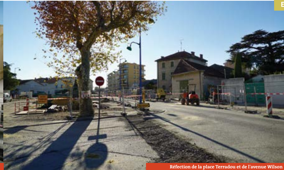
Réfection de la place Terradou et de l'avenue Wilson

> Le budget de chaque ville est contrôlé par la Chambre régionale des comptes, qui valide la gestion et la faisabilité des investissements. Carpentras a été contrôlée en 2015 et la CRC a validé ses opérations et prévisions.