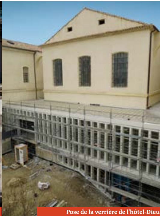
Pose de la verrière de l'hôtel-Dieu