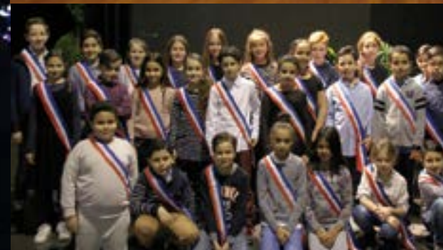
Le Conseil Municipal des Enfants