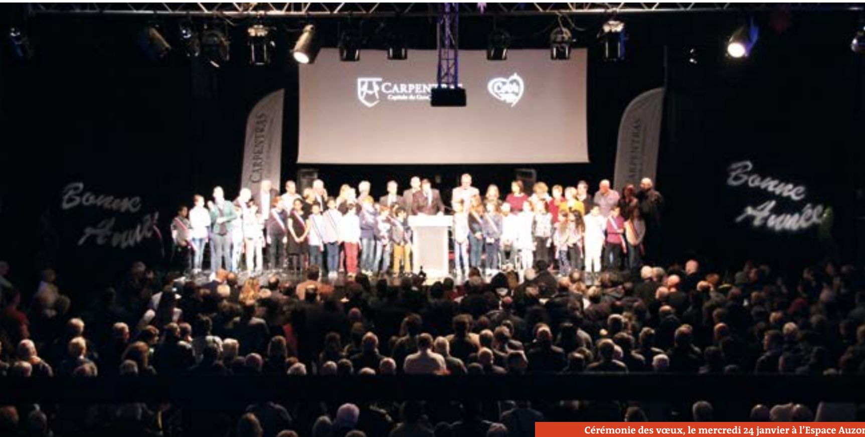
Cérémonie des vœux, le mercredi 24 janvier à l'Espace Auzon

Les mois de janvier et février sont le temps des rencontres entre les élus et administrés lors du repas des seniors, de la galette des rois, des vœux à la population et des noces d'or. Retour sur ces moments d'échanges et de convivialité.