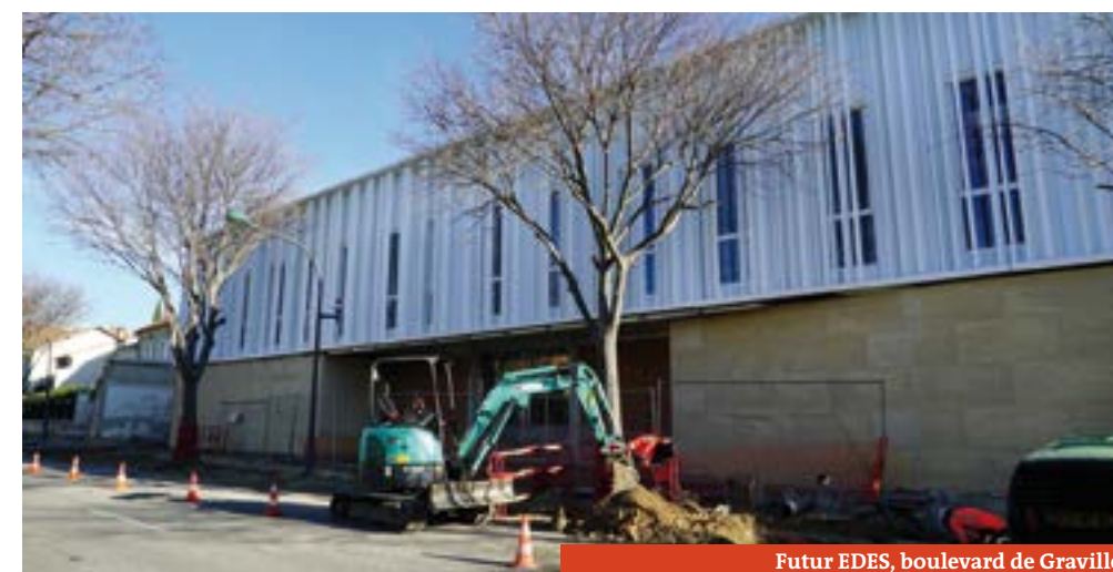
Futur EDES, boulevard de Graville

Les Espaces départementaux des Solidarités à Carpentras : - 23, rue Joseph de Lassone - boulevard de Graville (ouverture mi-avril) 04 90 63 95 00