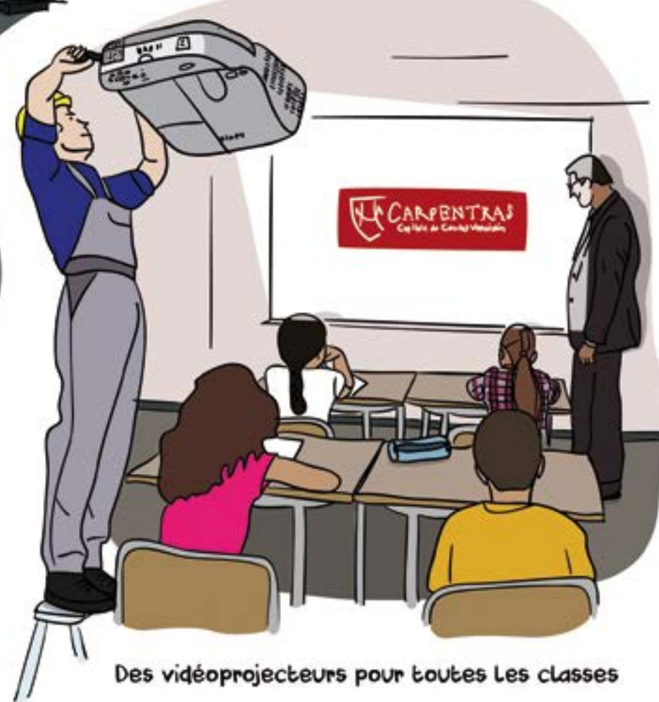
Des vidéoprojecteurs pour toutes les classes

Les communes comme Carpentras réalisent chaque année des dépenses et recettes pour mener à bien leurs projets. Ces travaux demandent une bonne gestion des deniers publics. Découvrez comment le budget municipal est géré et quels sont les grands projets pour 2018.