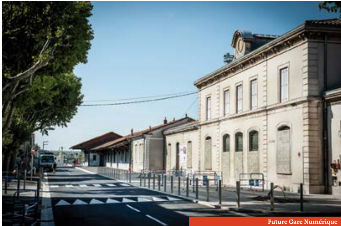
Future Gare Numérique

Les conseils municipaux sont ouverts au public. L'audience est toutefois tenue de ne pas participer et de veiller au respect et au bon déroulement du conseil municipal.