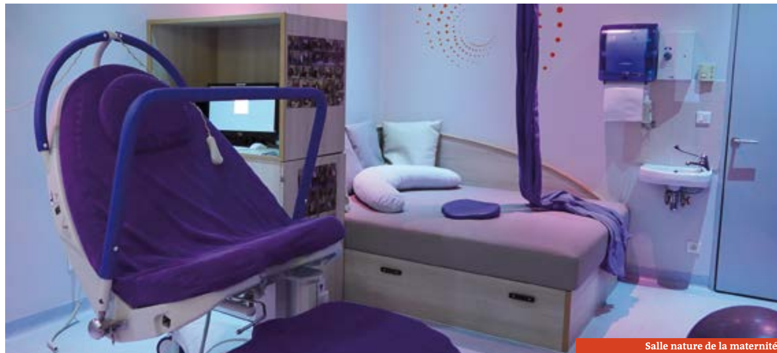
Salle nature de la maternité

La maternité de Carpentras est la troisième maternité publique du Vaucluse en nombre d'accouchements. Pour garder son excellent niveau et répondre aux besoins des patientes du Comtat Venaissin, elle fait évoluer sa structure et ses équipements.