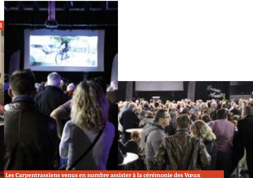
Les Carpentrassiens venus en nombre assister à la cérémonie des Vœux