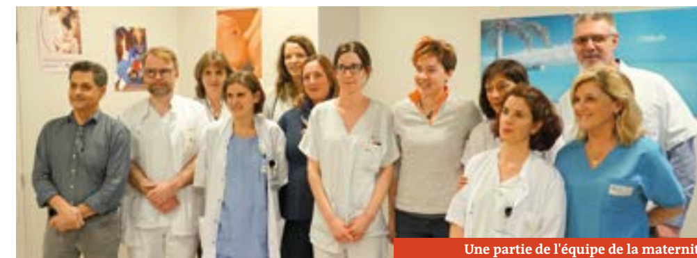
Une partie de l'équipe de la maternité

Vour trouverez plus d'informations sur carpentras.fr/medecins . ●