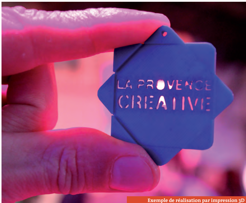
Exemple de réalisation par impression 3D