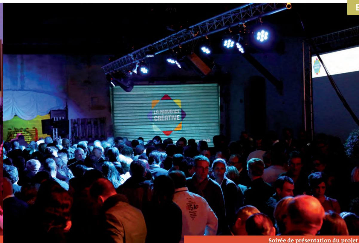
Soirée de présentation du projet

Gardez l'œil, le Camion numérique devrait débarquer avant 2018 !