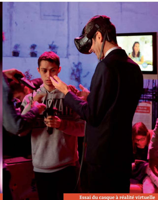
Essai du casque à réalité virtuelle

> Ces entreprises sont issues de domaines d'activité extrêmement variés. Leur volonté est d'assembler leurs compétences pour mener des projets communs ou chacune apporte sa pierre à l'édifice. L'objectif est de faire coopérer les structures pour qu'elles se complètent et apportent leurs spécificités. En qualité d'ambassadrices, elles montrent aux entrepreneurs en devenir que La Provence Créative est ouverte à tous... tant qu'il y a de l'énergie ! C'est donc un projet ambitieux et tourné vers l'avenir qui se fonde toutefois sur une volonté d'incarner un territoire marqué par son identité et son terroir. Pour mener à bien ces projets de partenariat et de développement économique, les entreprises seront en contact avec la CoVe mais aussi des acteurs basés à Carpentras dans des lieux stratégiques situés au marché-gare et dans le quartier de la gare.