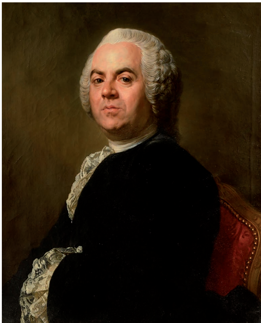
Portrait d'Antoine Louis Médetin, attribuée à Joseph-Siffred Duplessis (1778)

euros, c'est le prix total de l'acquisition de la toile de Duplessis qui sera exposée à l'Inguimbertaine.