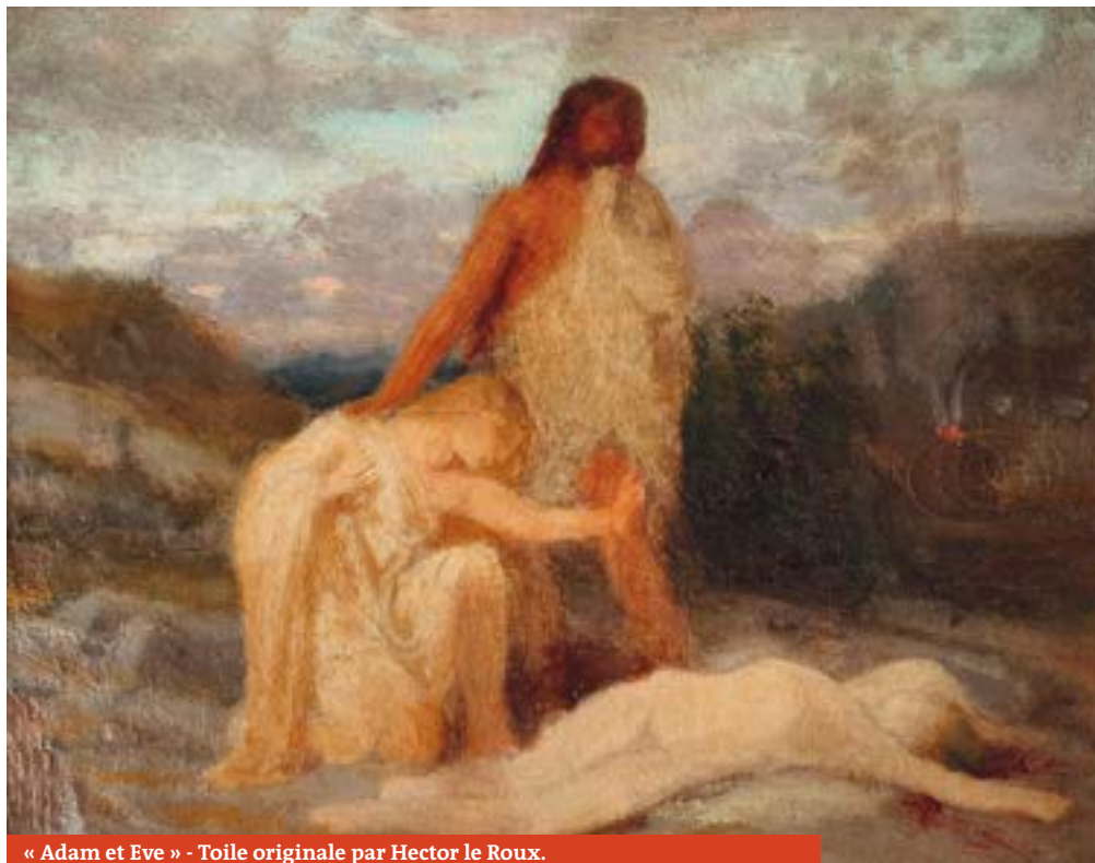
« Adam et Eve » - Toile originale par Hector le Roux.

heures, c'est le temps approximatif qu'il faudra à l'atelier Lazulum pour restaurer les deux toiles.