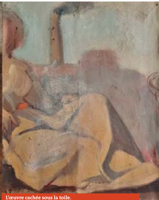
L'œuvre cachée sous la toile.