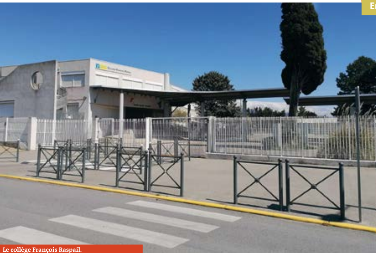
Le collège François Raspail.