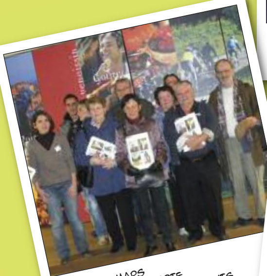
SAMEDI 12 MARS JOURNÉE DÉCOUVERTE POUR LES NOUVEAUX ARRIVANTS OFFICE DE TOURISME