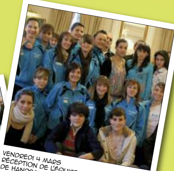
VENDREDI 4 MARS RÉCEPTION DE L'ÉQUIPE FÉMININE DE HANDBALL D'ARMÉNIE SALLE DU CONSEIL