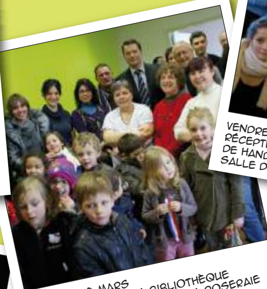
MERCREDI 2 MARS INAUGURATION DE LA BIBLIOTHÈQUE JEUNESSE AU CHÂTEAU DE LA ROSERAIE