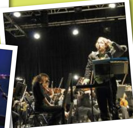
MARDI 15 MARS SPECTACLE ENFANTS "PETER PAN" ESPACE AUZON