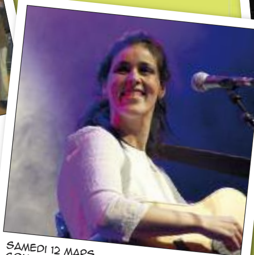
SAMEDI 12 MARS SOUD MASSI ESPACE AUZON