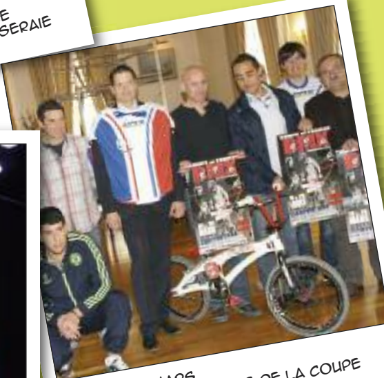
VENDREDI 11 MARS CONFÉRENCE DE PRESSE DE LA COUPE DE FRANCE DE BMX SALLE DU CONSEIL