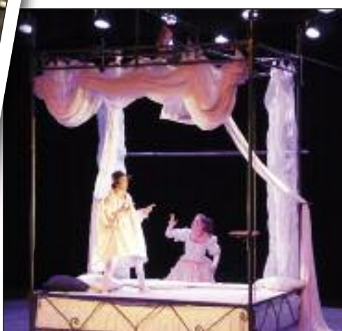
MERCREDI 9 MARS SPECTACLE ENFANTS "BLANCHE-NEIGE" ESPACE AUZON