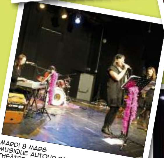
MARDI 8 MARS MUSIQUE AUTOUR D'UN VERRE "LIPSTICK" THÉÂTRE DE LA CHARITÉ