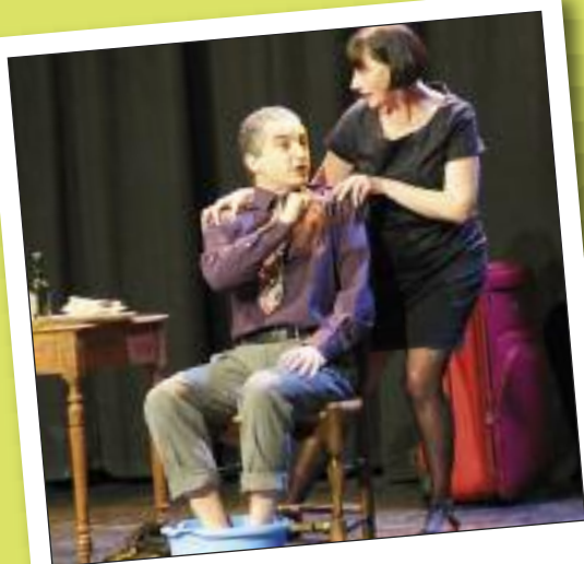
LUNDI 14 FÉVRIER THÉÂTRE "A COMME AMOUR" ESPACE AUZON