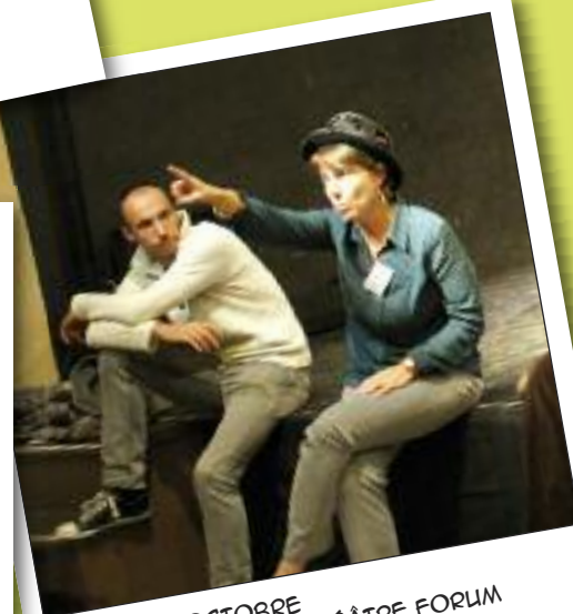
JEUDI 20 OCTOBRE PORTES OUVERTES THÉÂTRE FORUM THÉÂTRE DE LA CHARITÉ