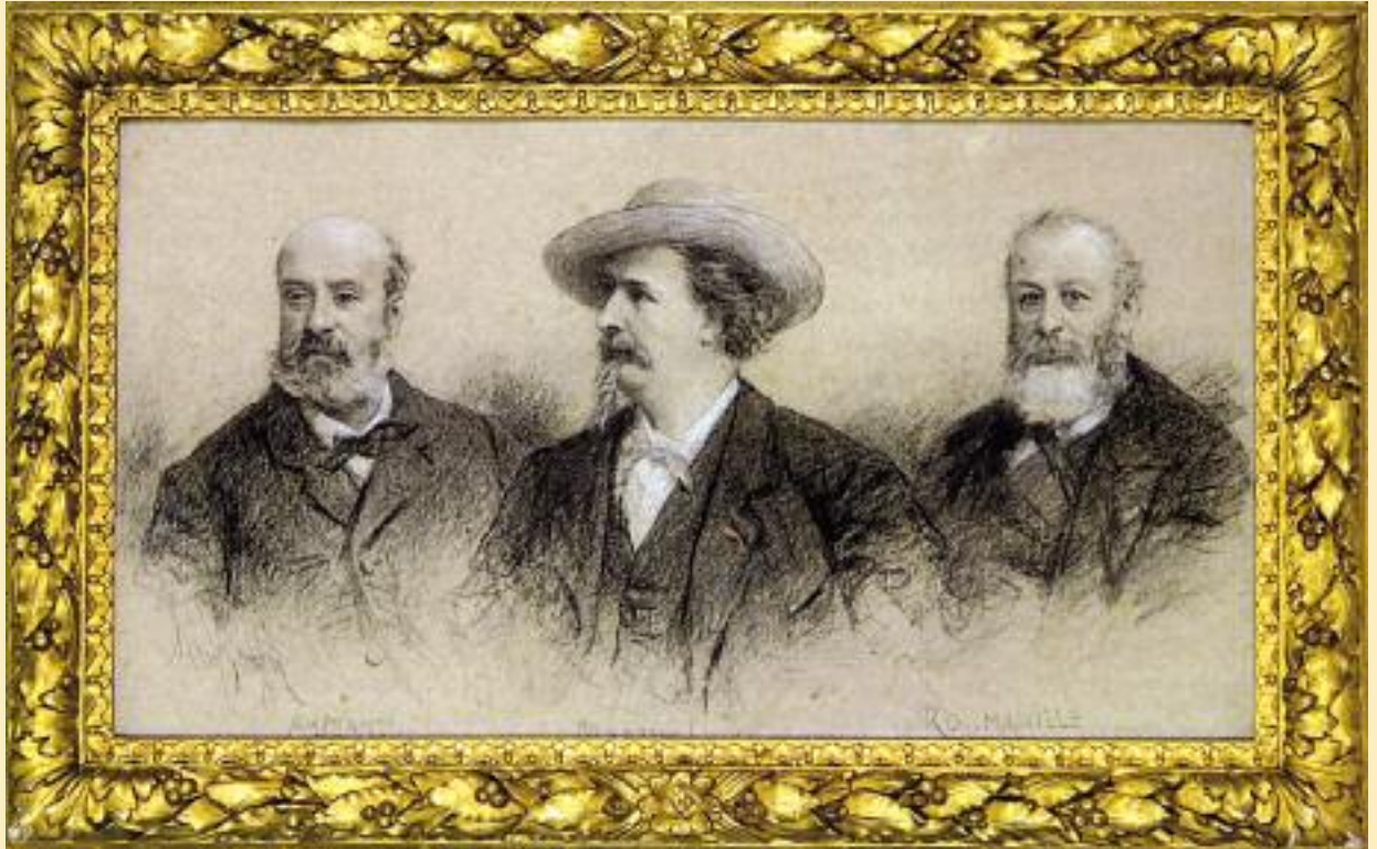
Aubanel, Mistral et Roumanille. Fusain avec rehauts de craie blanche, signé et légendé d'Eugène Lagier (36,5 x 65 cm).

Réputée pour ses fonds bibliophiliques, musicaux et graphiques ainsi que pour ses quatre collections muséographiques, l'Inguimbertaine réunit un ensemble cohérent et complémentaire d'œuvres et de documents patrimoniaux d'un intérêt inestimable. Grâce à des dons et à un budget annuel spécifique voté par le Conseil municipal, l'institution s'enrichit tous les ans.