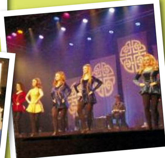
MERCREDI 2 NOVEMBRE CELTIC LEGENDS ESPACE AUZON