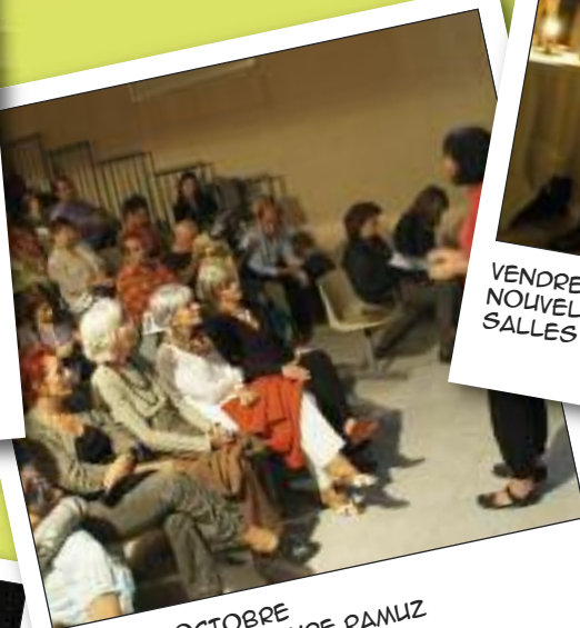
JEUDI 13 OCTOBRE BONHEUR DE LECTURE RAMUZ THÉÂTRE DE LA CHARITÉ