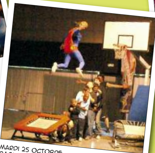
MARDI 25 OCTOBRE BASKET ACROBATIQUE ESPACE AUZON