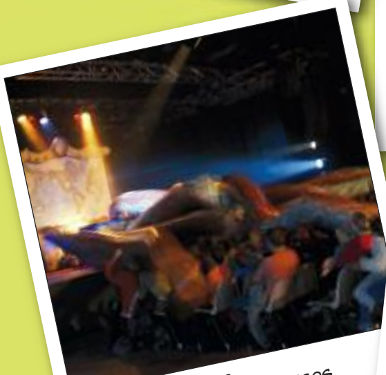
SAMEDI 22 OCTOBRE 20 000 LIEUES SOUS LES MERS ESPACE AUZON