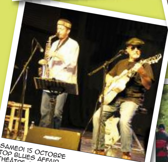
SAMEDI 15 OCTOBRE TOP BLUES AFFAIR THÉÂTRE DE LA CHARITÉ