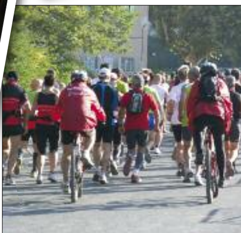
DIMANCHE 16 OCTOBRE COURSE PÉDESTRE "RONDE DU BERLINGOT"