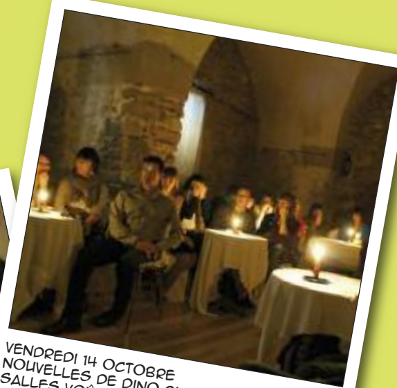
VENDREDI 14 OCTOBRE NOLIVELLES DE DINO BUZZATTI SALLES VOÛTÉES