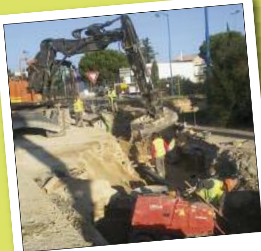
JEUDI 13 OCTOBRE TRAVAUX ASSAINISSEMENT ROCADE SUD-OUEST