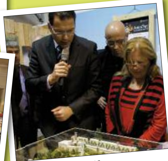
VENDREDI 25 NOVEMBRE INAUGURATION DU STAND DE LA VILLE ET PRÉSENTATION DE LA MAQUETTE DE LA "COULÉE VERTE" À LA FOIRE ST SIFFREIN