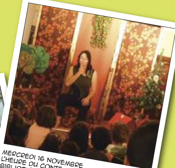
MERCREDI 16 NOVEMBRE L'HEURE DU CONTE BIBLIOTHÈQUE SECTION JEUNESSE