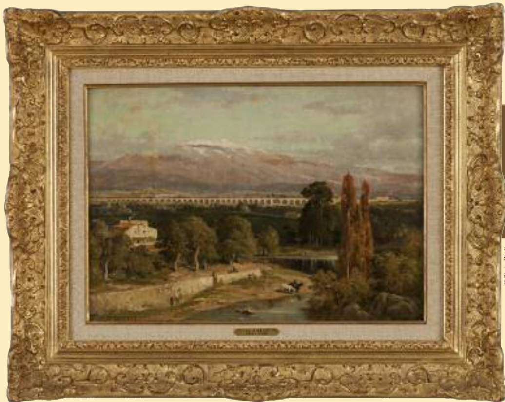
Jules Laurens, Vue de l'Auzon, de l'aqueduc de Carpentras et du Mont Ventoux (H. : 32,5 cm ; L. : 46 cm).

À ce titre, elle bénéficiera d'une subvention significative du Fonds Régional d'Acquisition des Musées (FRAM) de Provence-Alpes-Côte d'Azur.