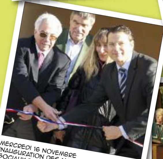
MERCREDI 16 NOVEMBRE INAUGURATION DES NOUVEAUX LOGEMENTS SOCIAUX "LES JARDINS DE MELCHIOR"