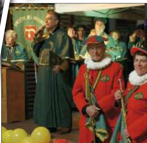
VENDREDI 18 NOVEMBRE BODEGAS PRIMEUR PARVIS DE LA MAISON DES VINS