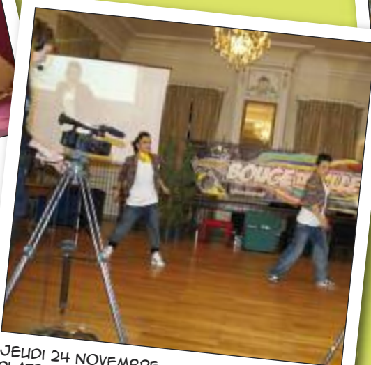
JEUDI 24 NOVEMBRE PLATEAU TV PARTICIPATIVE SALLE DU CONSEIL DE L'HÔTEL DE VILLE