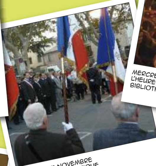
VENDREDI 11 NOVEMBRE CÉRÉMONIE PATRIOTIQUE PLACE DU 25 AOÛT 1944