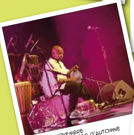
SAMEDI 19 NOVEMBRE FESTIVAL DES SOIRÉES D'AUTOMNE CONCERT GUËM ESPACE AUZON