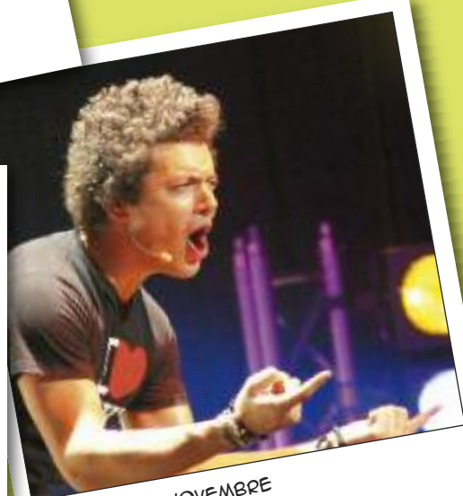
VENDREDI 18 NOVEMBRE SPECTACLE KEV ADAM'S ESPACE AUZON